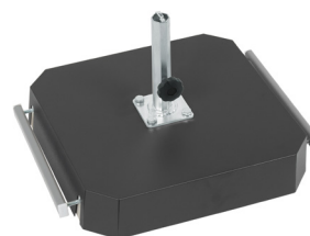
Stahlhaube als zusätzliche Option